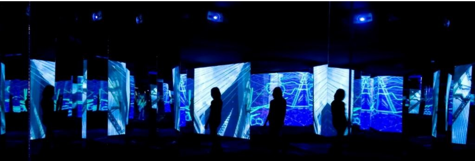
Mostra Geografías Celulares/Territórios Complexos . Espacio Fundación Telefónica, Buenos Aires, 2009

Nella Galleria Cândido Portinari , dal 21 settembre al 21 ottobre , verrà esposta l'installazione Territórios Complexos 2334s 4639w , una nuova visione della città di San Paolo incentrata sull'Avenida Paulista, considerata lo snodo principale fin dalla sua apertura nel 1891. L'Avenida Paulista oltre a possedere 22 eliporti con un movimento di 100 atterraggi giornalieri, 44 antenne di telecomunicazioni e 1,5 milioni di pedoni per 2,8 km di lunghezza, è la sede di imprese private e pubbliche responsabili per la gestione del 46% del PIL brasiliano.