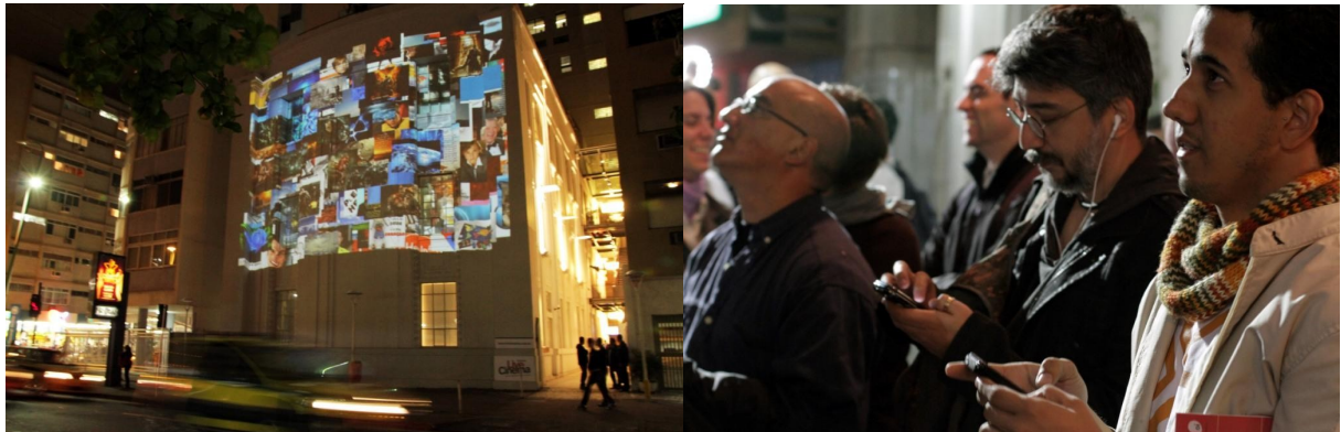
Mostra Live Cinema 2011.

Su invito dell'Ambasciata del Brasile a Roma e inseriti tra gli eventi di Roma Art2Nights e dell' Outdoor Urban Art Festival , gli artisti Rachel Rosalen e Rafael Marchetti presentano in Prima Nazionale a Roma le opere Territórios Complexos 2334s 4639w e SocketScreen , una nuova prospettiva della produzione contemporanea nonché dell'innovazione artistica e tecnologica brasiliana.