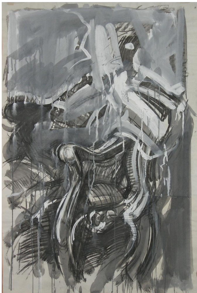
Marcelo Salvioi, Gran Personaje, 2010, tecnica mista su carta, 100x68 cm