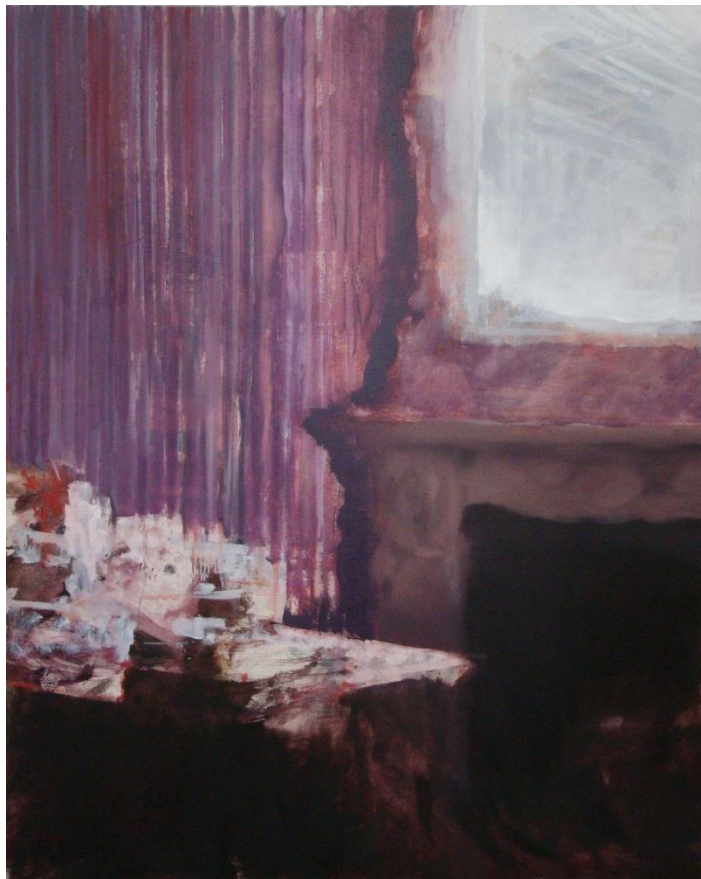
Simon Edmondson, Sanctum, 2009, olio su tela, 152x122 cm

La mostra si avvale del contributo di furdess, Valrhona e del St. Regis - Grand Hotel Rome.